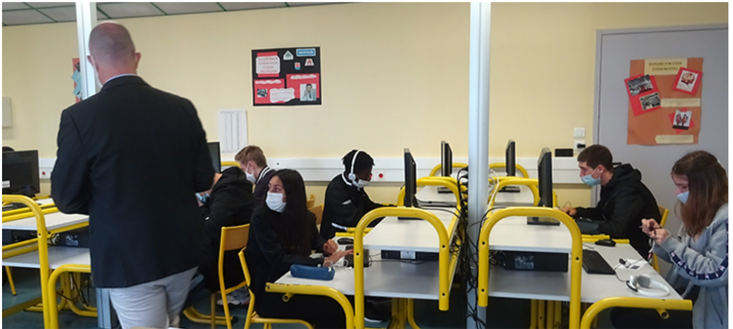
Test de positionnement en CAP au lycée Joubert-Emilien Maillard d'Ancenis

Les élèves en première année de CAP ont passé jeudi 22 septembre la deuxième session du test de positionnement Linu (Littérature et Numératie) dont l'objectif est d'identifier les acquis et les besoins de chaque élève. Au programme, des exercices pour évaluer la capacité des élèves à raisonner ma-thématiquement pour résoudre des problèmes liés au quotidien.