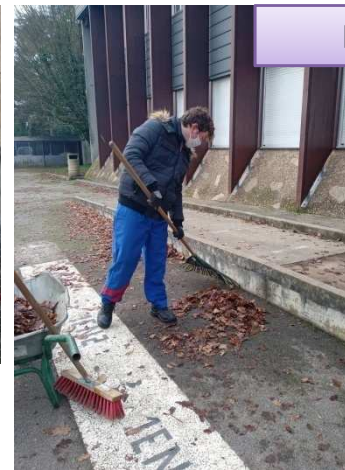
Mini-stage à l'EREA