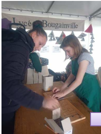
Forum des métiers