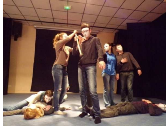
Pédagogie de projet