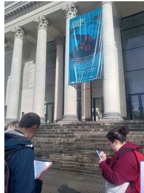
sorties scolaires et culturelles